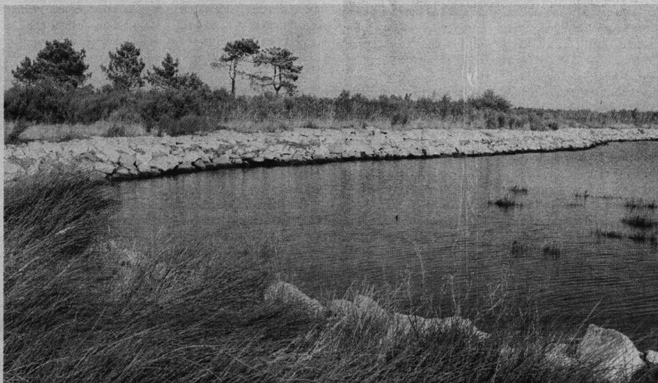
TRAJECTO prolonga-se por 10,5 quilómetros e situa-se na marginal da Ria

O projecto foi desenvolvido com a empresa Ecoinside, equipa responsável pela implementação do BioRia em Estarreja, no âmbito do programa “Murtosa Ciclável”, abrindo caminho para divulgar zonas desconhecidas do património natural da Murtosa e Ria de Aveiro. O percurso tem vias sinalizadas que conduzem a locais de interesse ecológico, paisagístico e cultural, espaços para descanso, placas informativas e painéis interpretativos da fauna e flora existentes. O investimento também dotou o percurso com locais para esta-